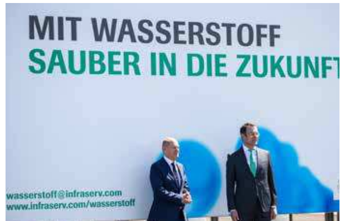
Kanzler zu Besuch: InfraserV nutzt Wasserstoffantrieb für den Zugverkehr.

In Deutschland haben rund 20 Millionen Arbeitnehmende Anspruch auf Vermögenswirksame Leistungen (VL). Bis zu 40 Euro pro Monat erhalten sie dann vom Arbeitgeber. Dazu gibt es vom Staat die sogenannte Arbeitnehmersparzulage von bis zu 80 Euro im Jahr, sofern das zu versteuernde Jahreseinkommen 20.000 Euro (Alleinstehende) bzw. 40.000 Euro (Verheiratete) nicht überschreitet. Auch Berufsanfänger/-innen und Schulabgänger, die in diesem Herbst eine Ausbildung beginnen, sollten prüfen, ob sie nicht mit VL sparen können. Im Arbeitsvertrag, Tarifvertrag oder einer Betriebsvereinbarung steht, ob der Arbeitgeber einen Zuschuss zu den VL zahlt. Meist ist dieser geringer als die 40 Euro im Monat, den Rest können Arbeitnehmende aus eigener Tasche aufstocken. Danach: Aktienfonds aussuchen (Hilfe gibt's in jeder Sparkasse), die Bescheinigung über den VL-Sparplan dem Arbeitgeber geben, und schon geht's los. Das Geld wird dann monatlich vom Gehalt abgebucht.