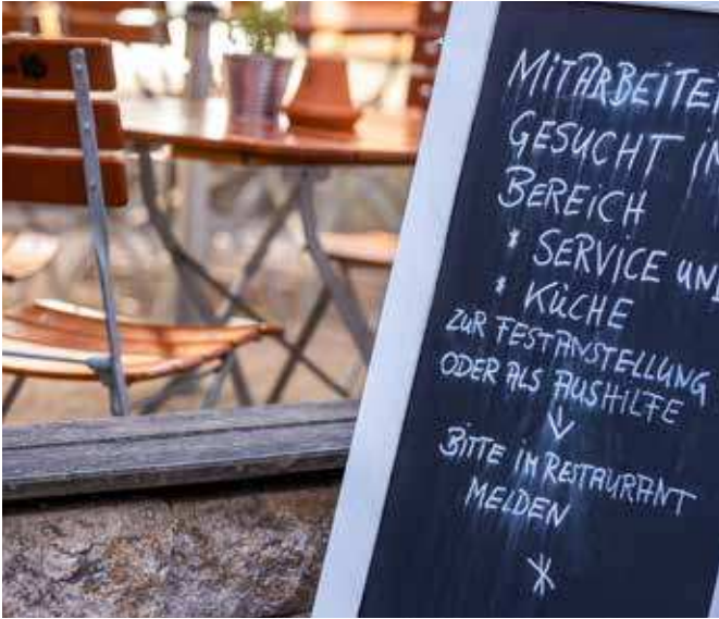
Bedienung gesucht: Eine generelle Gastronomie-Flucht gibt es aber nicht.

Bereichen tätig, die nicht ihrem Fachwissen entsprechen. Wenn wir die auch im Alter noch besser einsetzen könnten, würde das dem ganzen Arbeitsmarkt erheblich helfen. Aber selbst mit dem gesamten Potenzial des inländischen Arbeitsmarktes ist das Problem nicht zu lösen. Wir brauchen deutlich mehr Zuwanderung.