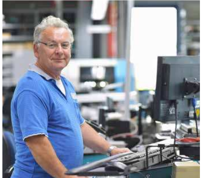
Nicht wie in den 90ern: Ältere Mitarbeitende sind als Arbeitskräfte gesucht.

Corona, Energiekrise, globale Verwerfungen – leicht haben es die Jungen heute nicht. Und allein auf die stattliche Rente können sie auch nicht bauen. Außerdem erbt nicht jeder gleich ein Vermögen. Aber in der Tat: Arbeitskräfte sind gefragt, und da haben die Jugendlichen heute schon sehr gute Karten. Wobei nicht alles Gold ist, was glänzt. Wir haben andererseits auch einen großen Niedriglohnbereich aufgebaut.