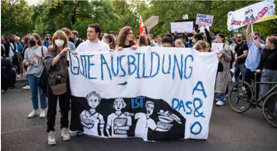
Walk of Care: Am internationalen Tag der Pflegenden protestieren Mitarbeitende und Auszubildende gegen den Notstand in ihrem Pflegeberuf. Sie fordern unter anderem eine menschenwürdige Pflege, höhere Löhne und bessere Arbeitsbedingungen für alle Gesundheitsberufe.